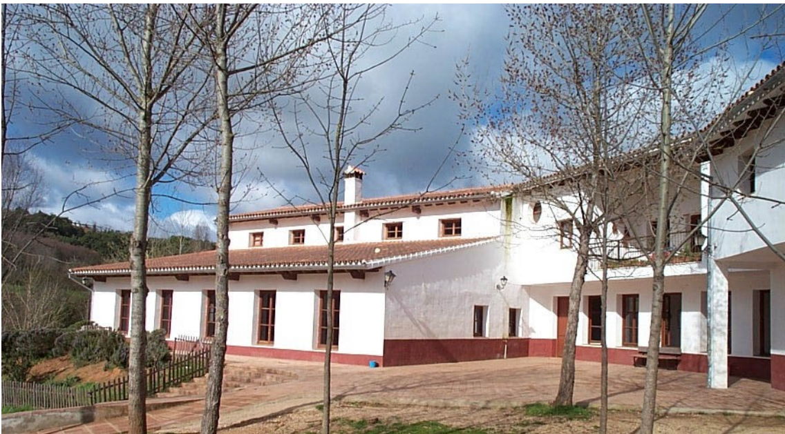
Centro de Naturaleza "El Remolino". Cazalla de la Sierra, Sevilla.

Las primeras granjas-escuela nacen en Andalucía con la vocación de cambiar las formas de enseñar en la escuela, son creadas por equipos de personas con un alto sentido romántico, muy críticos con la escuela tradicional, que se aventuraron a organizar y poner en marcha un proyecto educativo que se planteaba como una alternativa a las formas tradicionales de enseñar, con el objetivo de mostrar al profesorado un modelo práctico de educación activa y de dar a los escolares la oportunidad de vivir una experiencia de convivencia basada en la solidaridad y el respeto en contacto directo con la vida rural y natural.