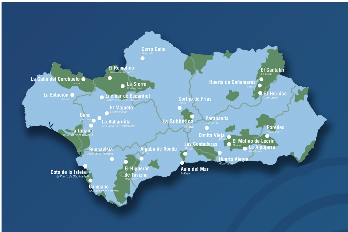
Centros de Educación Ambiental en la Red Ondas