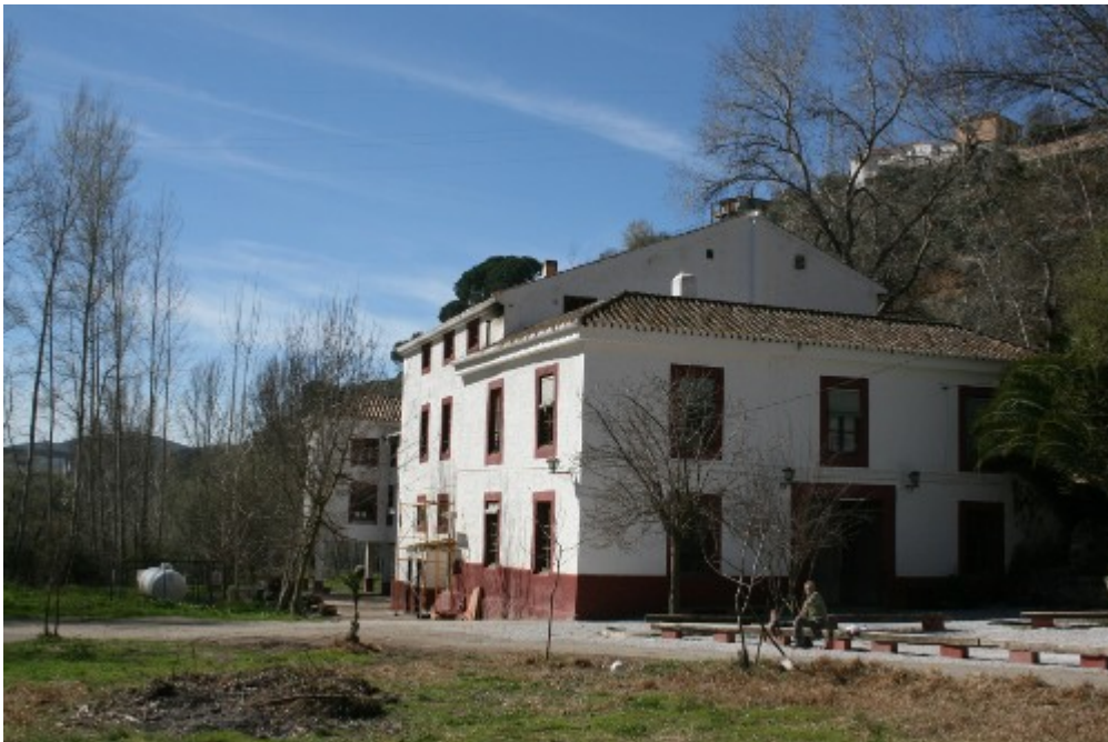
Granja-escuela "El Molino de Lecrín". Dúrcal, Granada.

Un Centro de Educación Ambiental está constituido por unas instalaciones fijas , que dan la posibilidad de alojamiento y manutención a los usuarios, adaptadas al proyecto de Educación Ambiental del centro , el cual estará en consonancia con su entorno y será desarrollado necesariamente por un equipo educativo formado y preparado para realizarlas.